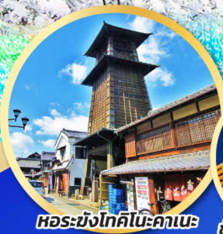
หอรบขังโทคิโนะคาเนะ