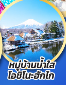
หมู่บ้านน้ำใส ไอชิโนะอัทสึ