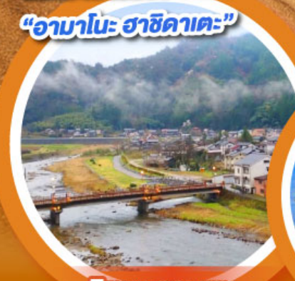
มิซาซะออนเซน