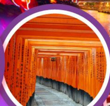
ศาลเจ้าฟุชิมิอินาริ