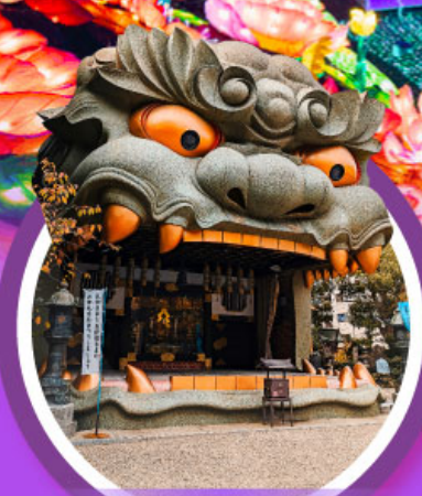
ศาลเจ้านิมบะ ยาชากะ