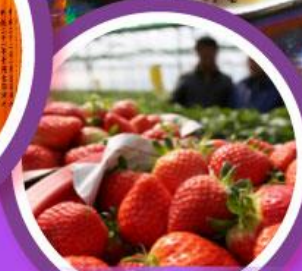
เก็บสตอร์วเบอร์รี่