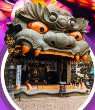
ศาลเจ้านิมบะ ยาชากะ