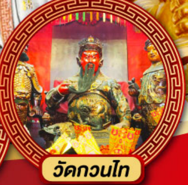
วัดกวนไท