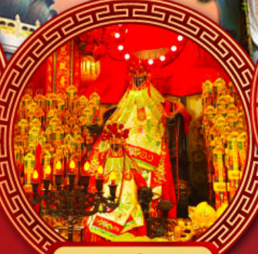
วัดเจ้าแม่กวนอิม ฮ่องกง