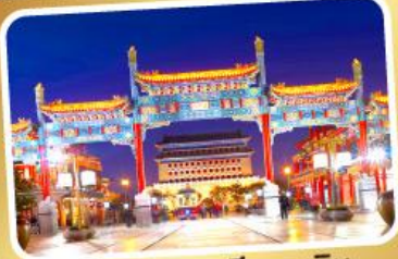
ถนนโบราณเทียนเหมิน