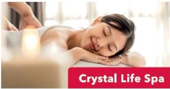
Crystal Life Spa