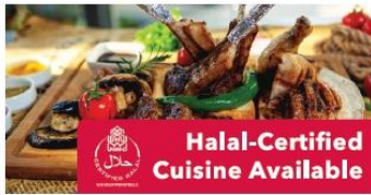
Halal-Certified Cuisine Available