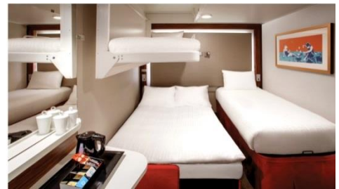
พัก 3-4 ท่าน