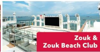
Zouk & Zouk Beach Club