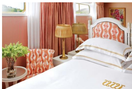
CLASSIC (CS) Luxurious riverview stateroom (15 SQ.M.)

บริษัท ควอลิตี้ เอ็กซ์เพรส จำกัด มีบริการซื้อตั๋วเครื่องบิน และ แผนกวีซ่า พร้อมบริการท่านแบบครบวงจร