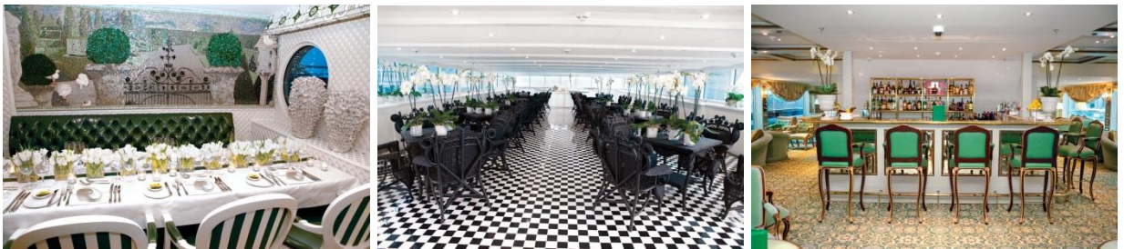
อิสระพักผ่อนตามอัธยาศัย

รับประทานอาหารค่ำ ที่ห้องอาหาร Restaurant de Versailles