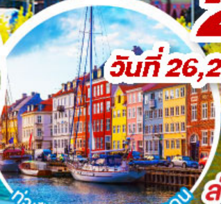
ท่าเรือฮาวน์.โตปเปอเทม