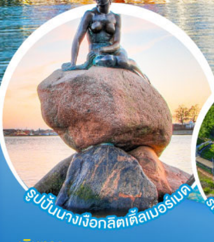
รูปปั้นนางเงือกลิตเติลเมอร์เมด