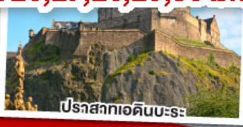
ปราสาทอดินเบิร์น