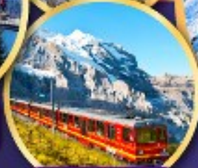
ยอดเขาจุงเฟรา