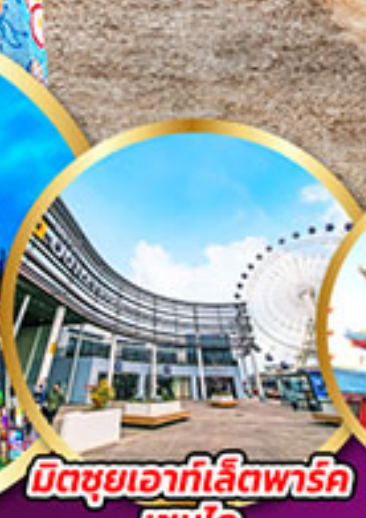
มิตซูเอากะที่เล็ดพาร์ค เซนได