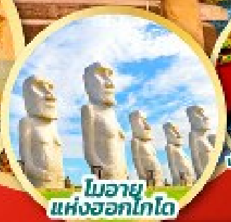
โมอาย แห่งออกโทโต