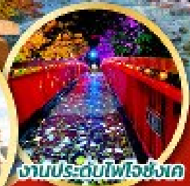
งานประดับไฟโจซังเค