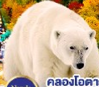
คลองโอดารุ