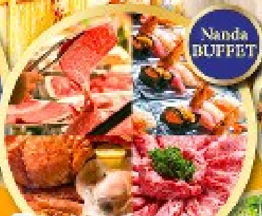
พิเศษ!! บุฟเฟ่ต์ร้าน NANDA ดีที่สุดในชิบโปโร