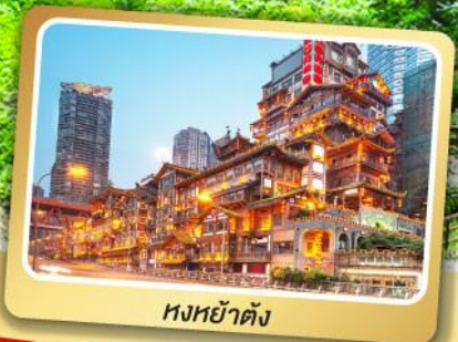
หงหย่าตัง