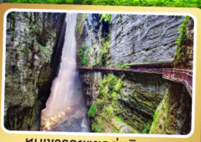
หุบเขารอยแยกอุหลิงซาน