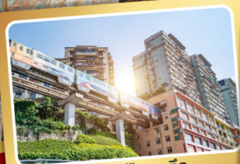
รถไฟฟ้ากะลุดัก