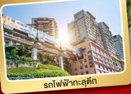
สทไฟฟ้าทะลุติ๊ก