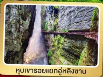
หุบเขารอยแยกอู่หลิงซาน