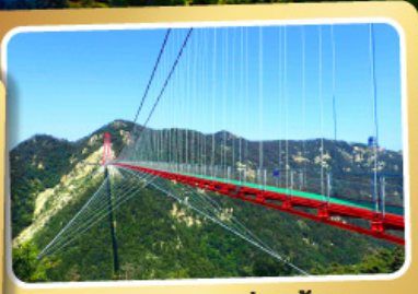
สะพานแวงนอ้ายจ้าย