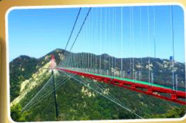
สะพานแขวนอ้ายจ้าย