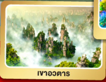
เวาอวดาร