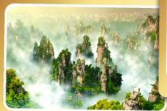
เวาอวดาร