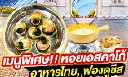
เมนูพิเศษ! หอยเอสคาโก้ อาหารไทย, ฟองดูชีส