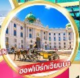
ออฟฟิศโรมัน