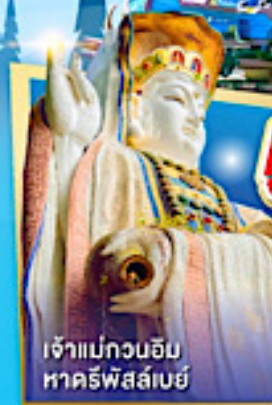
เจ้าแม่กวนอิม หาคีรีพิสัย