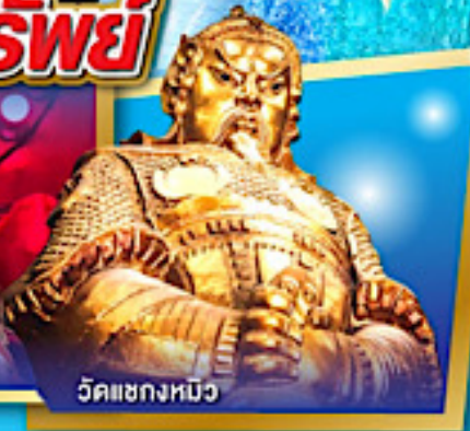
วัดเขากงหนิว

สนุกสนานไปกับสวนสนุก ดิสนีย์แลนด์แบบเต็มวัน