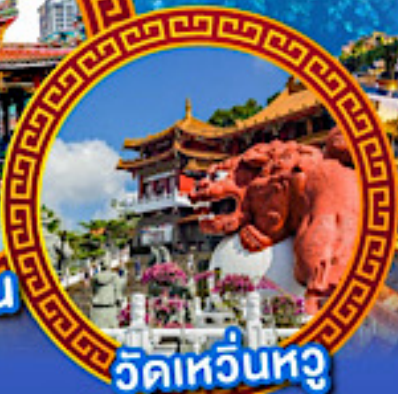
วัดเหวียนหวู