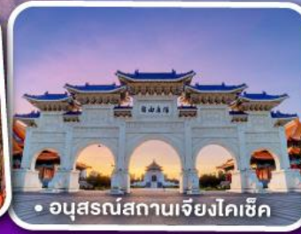
• อนุสรณ์สถานเจียงโคเช็ค