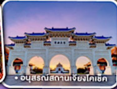
• อนุสรณ์สถานเจียงโคเซ็ก