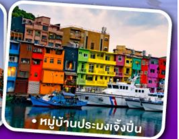
• หมู่บ้านประมงเจิ้งปิ่น