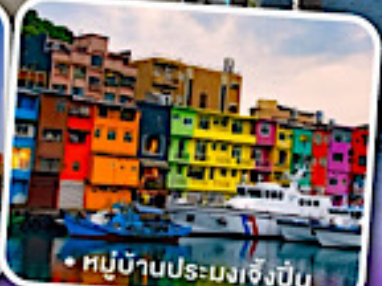
• หมู่บ้านประมงเจิ้งปิ่น