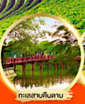
ทะเลสาบคินคาบ