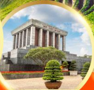
สุสานโฮจิมินห์