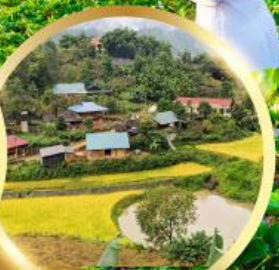
หมู่บ้านกัตกัต