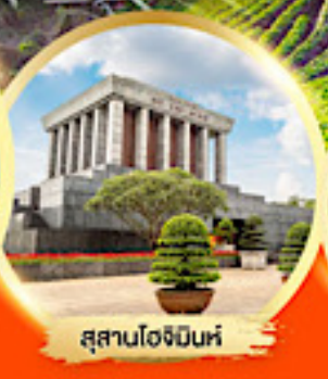
สุสานโฮจิมินห์