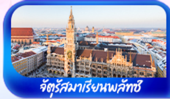
จัตุรัสมาเรียนพลัทซ์