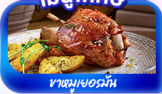
ขาหมูเยอรมัน