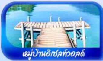
หมู่บ้านอิเซลทออลด์