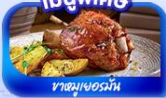
ขาหมูเยอรมัน