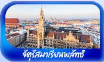
จัตุรัสมาเรียเนพลิกซ์