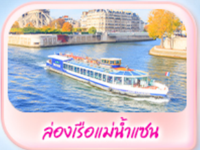
คลองเรือแม่น้ำแซน