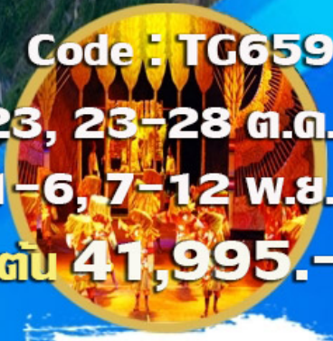
โซว์ทิเบต