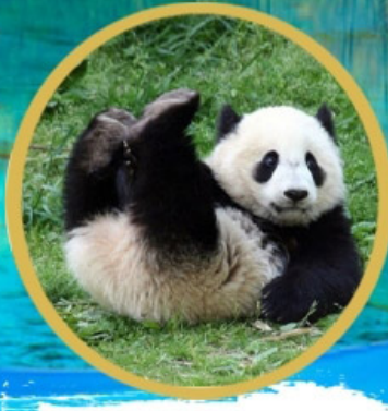
หมีแพนด้า