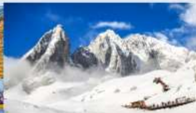
ภูเขาหิมะมิงกรหยก