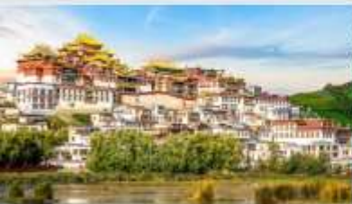
วัดลามะชงจ้านหลิน