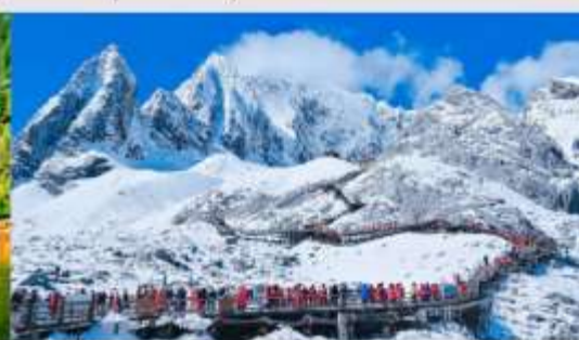
ภูเขาหิมะมิงกรหยก