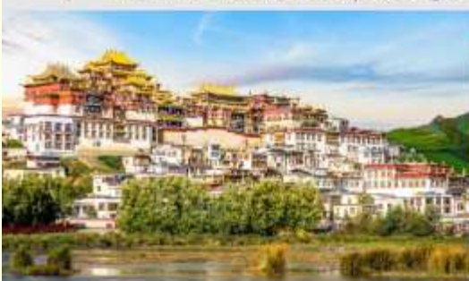
วัดลามะชงจ้านหลิน