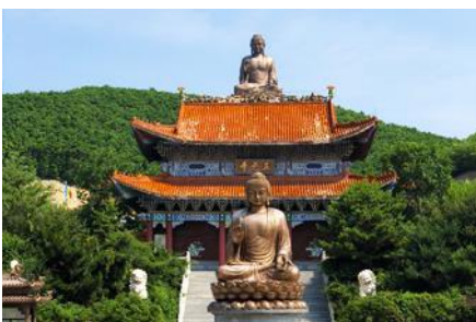
องค์พระพุทธรูปใหญ่จันที้

พักที่ WAN HAO INTER HOTEL 4* หรือ โรงแรมในระดับเดียวกัน เมืองตุนฮว่า