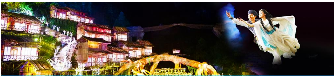
The Love Story of a Wooden Man and Fairy fox

หลังอาหารนำท่านเดินทางเข้าที่พัก หรือท่านสามารถเลือกซื้อโปรแกรมเสริม เป็นบัตรชมการแสดง ชุด The Love Story of a Wooden man and Fairy fox หรือที่เรียกกันในหมู่นักท่องเที่ยวไทยว่า โชว์จิ้งจอกขาว เป็นการแสดงกลางแจ้งที่ทุ่มทุนสร้างอย่างสุดอลังการ เป็นการแสดงที่น่าดูชมที่สุดในเมืองจางเจียเจียะ การแสดงชุดนี้ใช้ภูเขาประติมากรรมเป็นฉากหลังประกอบการแสดง ซึ่งให้ความรู้สึกสมจริงเสมือนผู้ชมและนักแสดงอยู่ท่ามกลางธรรมชาติ ใช้ทีมงานนักแสดงหลายร้อยคน และระบบแสง สี เสียงที่ทันสมัยประกอบการแสดง อัตราค่าบริการสำหรับโปรแกรมเสริมการแสดงชุด The love Story of Wooden man and Fairy Fox ท่านละ 400 หยวน (หรือ 2,000 บาทขึ้นอยู่กับอัตราแลกเปลี่ยน) ระยะเวลาที่ใช้ในการเที่ยวชมการแสดง ประมาณ 3 ชั่วโมง รวมเวลาเดินทางไป กลับค่าบริการรวม ค่าบัตรเข้าชม ค่ารถรับ ส่ง และค่าน้ำดื่มของไกด์ท้องถิ่น