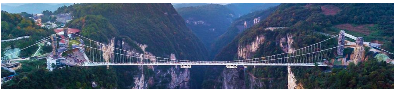
สะพานกระจกข้ามหุบเขาแกรนด์คอนยอน

หมายเหตุ การเลือกซื้อออฟชั่น ทางบริษัทขอสงวนสิทธิ์หากจำนวนผู้ซื้อไม่ถึง 15 ท่าน, ออฟชั่นนั้นไม่สามารถจัดให้ลูกค้าไปเที่ยวได้ จึงเรียนมาเพื่อให้ลูกค้าได้เข้าใจถูกต้องตรงกัน