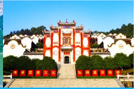
บ้านเกิดกวี ชวีหยวน