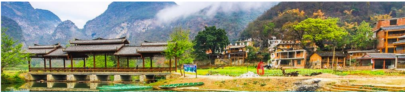
สวนดอกท้อ