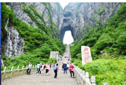
ประตูสวรรค์