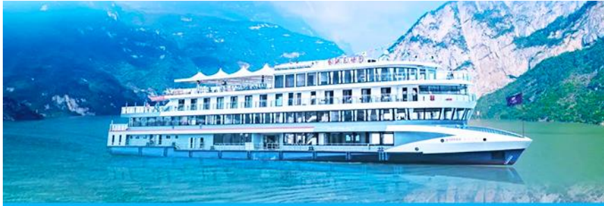
ล่องเรือชมเขื่อนสามผา