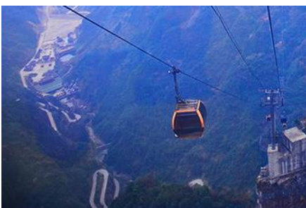
กระเช้าขึ้นเทียนเหมินซาน