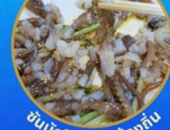
ชั้นนักกีฬาอาหารท้องถิ่น