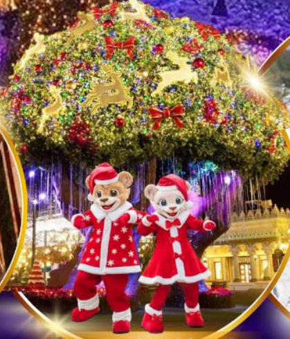
สวนสนุกเอเวอร์แลนด์ ฮิม พาร์ค