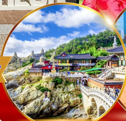
วัดแสดงยงกุงซา