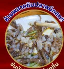
ห้ามพลาดชิมปลาหมึกสด!

โพฮังสเปซวอล์ก สกายวอร์ค ตามรอยซีรีส์ Hometown chachacha ถ่ายรูปชิคๆ หมู่บ้านวัฒนธรรมคิมซอน ขึ้นเคเบิลคาร์ ชมทะเลปูซาน นั่งรถไฟปูกบิก sky capsule ชิมของอร่อยตลาดแฮუნแด อิสระช้อปปิ้ง Lotte Duty Free