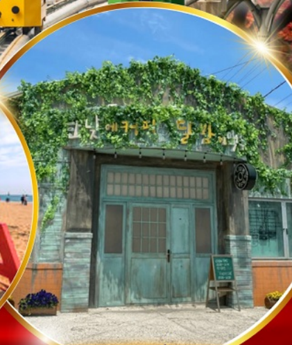
ตามรอยซีรีส์ดัง Hometown chachacha

โพฮังสเปซวอล์ก สกายวอร์ค ตามรอยซีรีส์ Hometown chachacha ถ่ายรูปชิคๆ หมู่บ้านวัฒนธรรมคิมซอน ขึ้นเคเบิลคาร์ ชมทะเลปูซาน นั่งรถไฟปูกบิก sky capsule ชิมของอร่อยตลาดแฮუნแด อิสระช้อปปิ้ง Lotte Duty Free