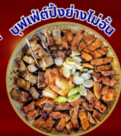
บุฟเฟ่ต์ปิ้งย่างไม่อั้น