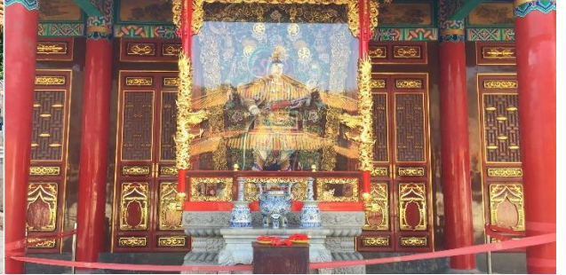
วัดห้วยทอง

นำท่านชมวัดห้วยทอง เป็นวัดใหญ่อันเก่าแก่ที่สุดของมณฑลยูนนาน ภายในตกแต่งร่มรื่นสวยงาม กลางลานมีสระน้ำขนาดใหญ่ สร้างมาตั้งแต่สมัยราชวงศ์ถังมีอายุยาวนานประมาณ 1,200 กว่าปี วัดห้วยทองที่สร้างแปลกที่สุดในจีนคือสร้างวัดต่ำกว่าภูเขา เนื่องจากวัดแห่งนี้ไม่ได้สร้างขึ้นเพื่อเป็นวัดโดยตรงแต่เคยเป็นศาลเจ้าแม่กวนอิมมาก่อน ดังนั้นคำว่า "ห้วยทอง" จึงเป็นชื่อที่ปรากฏในคัมภีร์ของเจ้าแม่กวนอิม