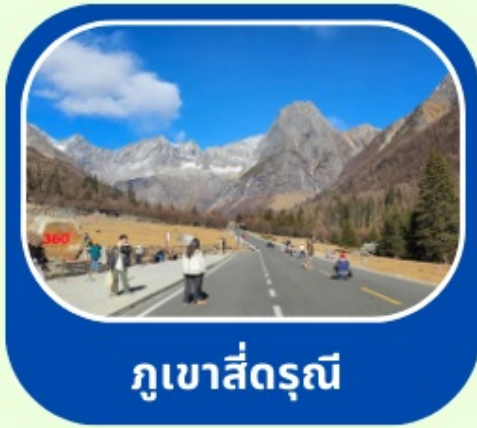
กุเขาสี่ดรุณี