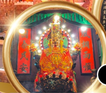
ขอพรซื้อขายอสังหาริมทรัพย์