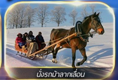
นั่งรถม้าลากเลื่อน

พักหมู่บ้านหิมะ ชมแสงสียามค่ำคืน ฟรีนั่งรถม้าลากเลื่อน