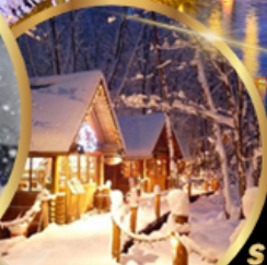
หมู่บ้านเทพนิยาย นิงเกิลเทอเรส