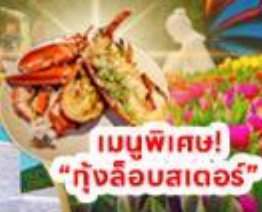
เมนูพิเศษ! "ทุ่งลือบสเตอร์"