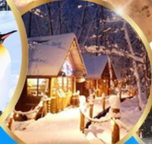
หมู่บ้านเทพนิยาย นิงเกิลทอเรส