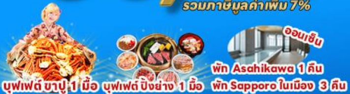
พิก Asahikawa 1 คืน

โฮโลก์! พิเศษ! บุฟเฟต์ ขาปู 1 มื้อ บุฟเฟต์ บิงชัง 1 มื้อ