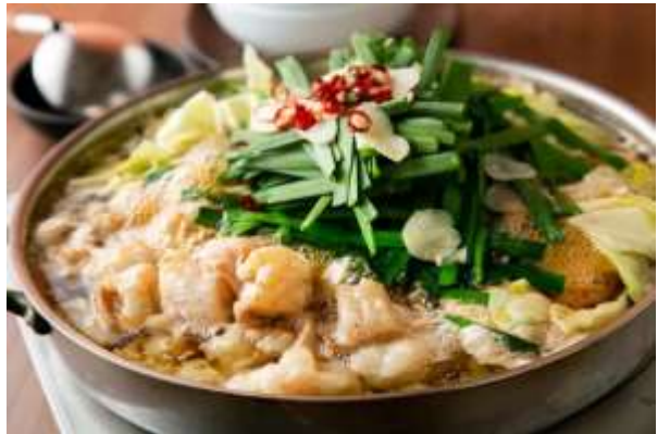
ร้านอาหารย่านยะไต (YATAI)

เย็น อิสระรับประทานอาหารค่ำตามอัธยาศัย เพื่อให้ท่านได้ช้อปปิ้งอย่างเต็มที่ (มีไกด์แนะนำ) ➡ พักค้างคืน ณ โรงแรม Nishitetsu Inn Hotel (★★★★) หรือเทียบเท่า ใจกลางย่านเทนจิน