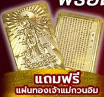
แถมพรี แผ่นทองเจ้าแม่กวนอิม