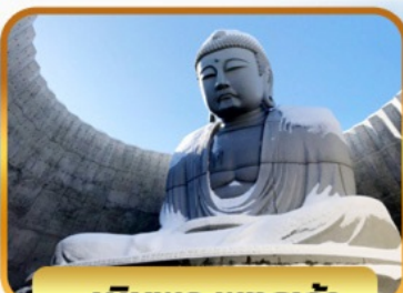
เป็นพระพุทธรเจ้า

05-10, 12-17, 19-24 พย. 26 พ.ย. - 01 ธ.ค. 67