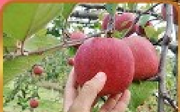
เก็บแอมเปิ้ล