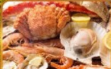
บิงย่างร้านดังเนินตะ