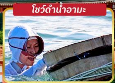
โซว์ดำน้ำอามะ