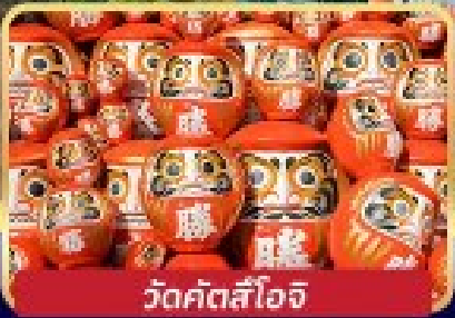
วัดคัตสึโอะจิ