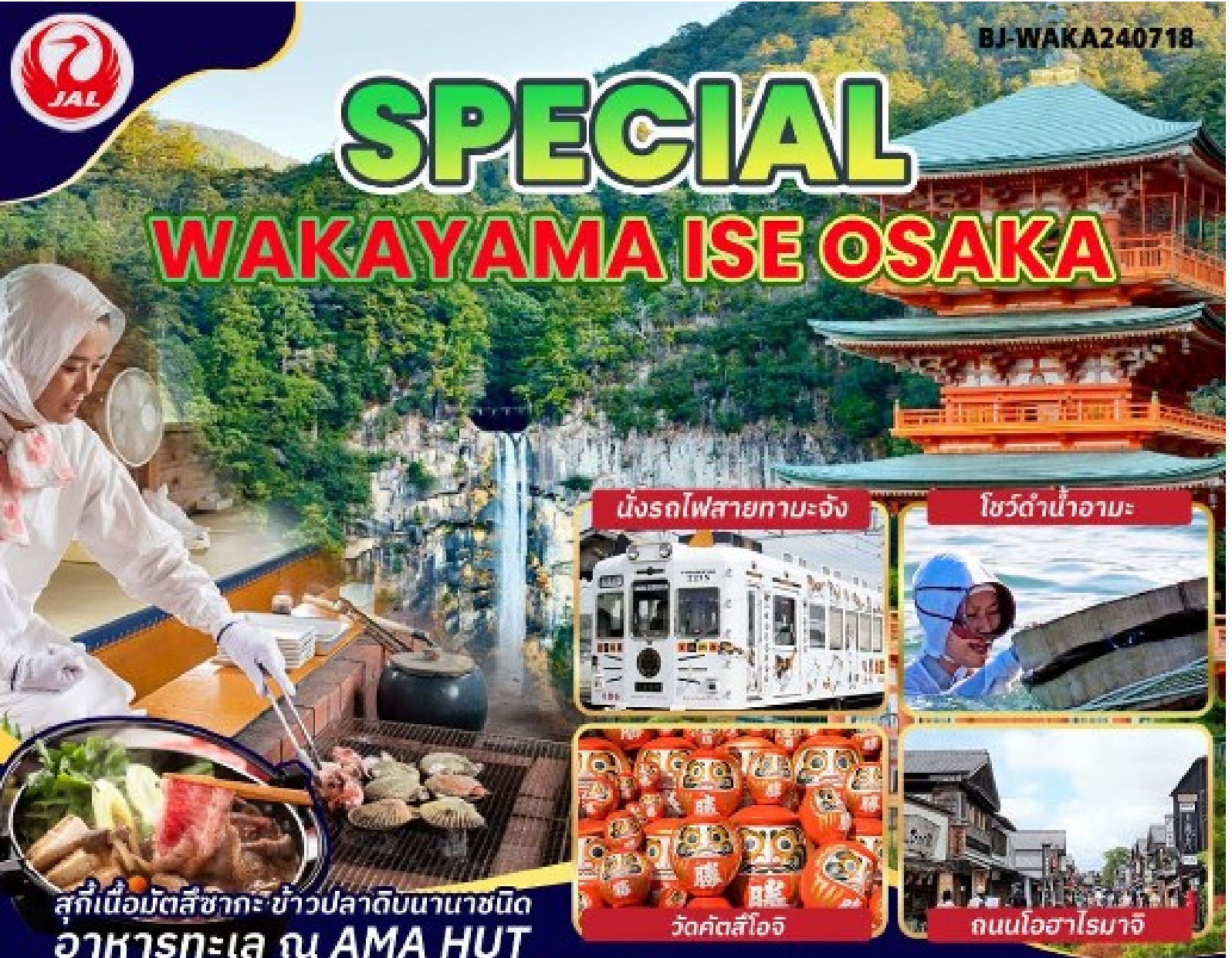
นั่งรถไฟสายทามะจิัง