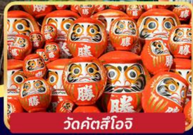
วัดคัตสึโองิ