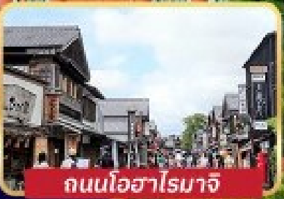
ถนนโอฮาโรมาจิ

สุกี้เนื้อมิตรสึซากะ ข้าวปลาดิบนานาชนิด อาหารทะเล ณ AMA HUT