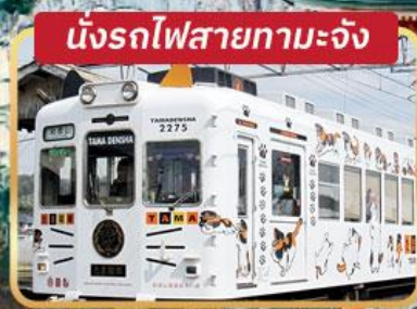
นั่งรถไฟสายทามะจัง