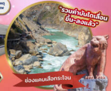
"รวมค่าบินได้เลื่อน บัน-ลงแล้ว"