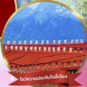
โชว์ความประทับใจลี่เจียง