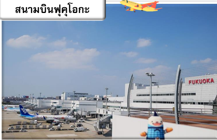
สนามบินฟุคุโอกะ

เวลา 00.55 น. ออกเดินทางสู่ สนามบินฟุคุโอกะ ประเทศ ญี่ปุ่น โดย สายการบินไทย เที่ยวบินที่ T5648