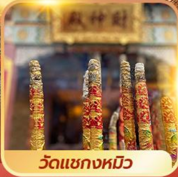
วัดแชกงหมิว