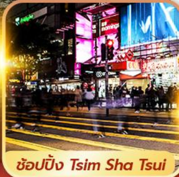
ซ็อบปิ้ง Tsim Sha Tsui