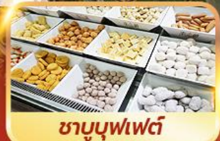
ชาบูบุฟเฟต์