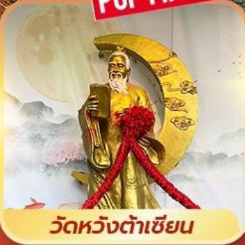
วัดหวังต้าเซียน