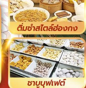
ติ่มซำสไตล์ฮ่องกง