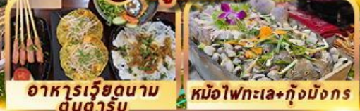
อาหารเวียดนาม ดนตรี