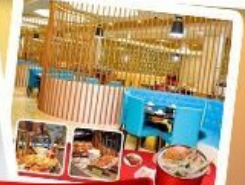
ก๊วยแม่น้ำ + HOTPOT SEAFOOD