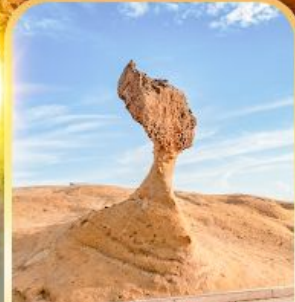
อุทยานเหยี่ยว