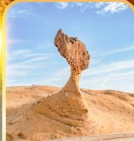
อุทยานเหยี่ยวหลิว