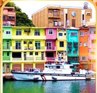
ตึกหลายสีท่าเรือเจินเปิง