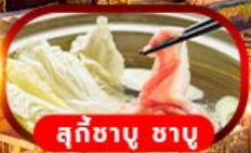
สุกี้ชาบู ชาบู