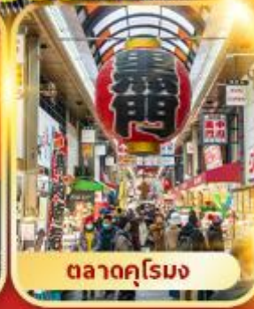
ตลาดคุโรมง