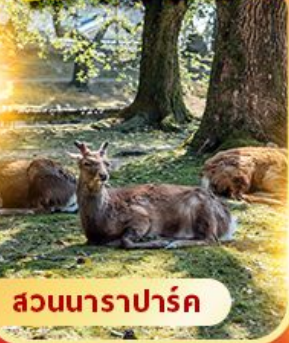
สวนนาราปาร์ค