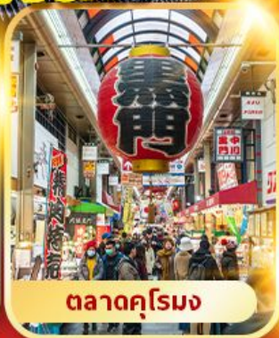
ตลาดคุโรมง